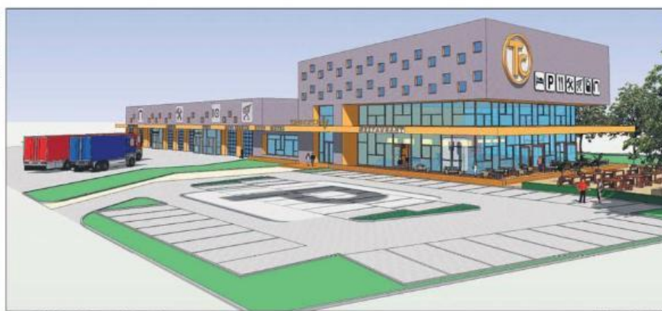
Zomoet Truckcity in Emmen er uit gaan zien.