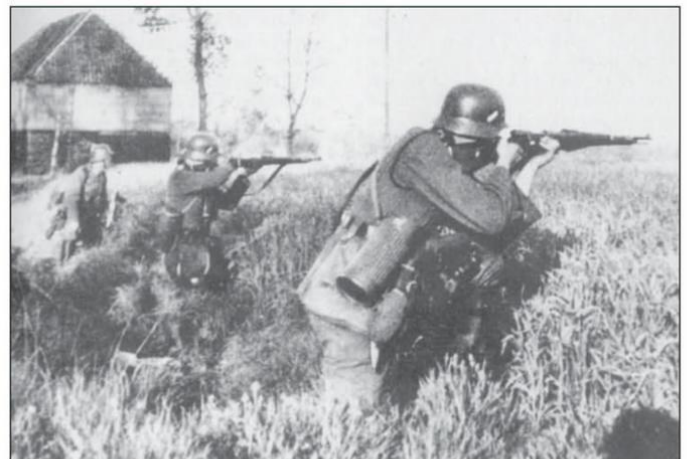
Duitse soldaten nemen de bunker bij de brug van Goseling onder vuur.