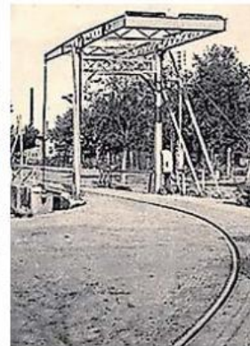
▲ De trambrug in Klazienaveen stond model.

De Klazienavener is geboren en getogen nabij het Scholtenskanaal met zicht op de brug. "Ik viste veel bij de brug. Ook herinner ik me de turfschepen die richting de Noritfabriek voerden. Af en toe viel er een blok turf in het water. Bewo-